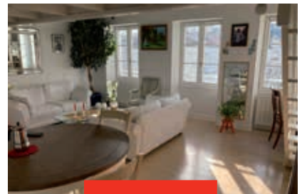
LA ROCHELLE – LA GENETTE Appartement / 65,99 m 2 / 3 pièces

520 000 € hors honoraires Honoraires charge acquéreur : 5,49 % TTC (30 200 €) DPE D / Mdt 895