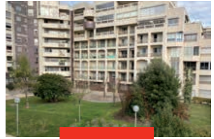
LA ROCHELLE – LA GENETTE Appartement / 86,80 m 2 / 3 pièces

380 000 € hors honoraires Honoraires charge acquéreur : 5 % TTC (19 000 €) DPE C / Mdt 6600