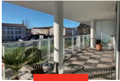
LA ROCHELLE – CENTRE VILLE Appartement / 62,15 m 2 / 3 pièces

520 000 € hors honoraires Honoraires charge acquéreur : 4,5 % TTC (23 400 €) DPE B / Mdt 6578