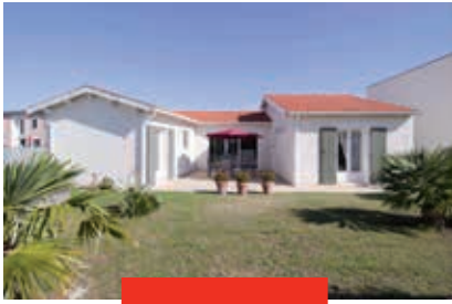
CHÂTELAILLON-PLAGE Maison / 88 m 2 / 3 pièces