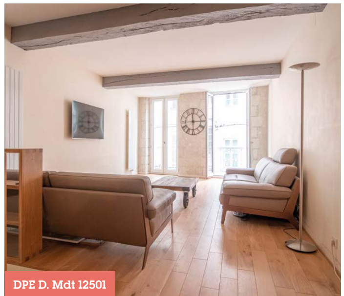
DPE D. Mdt 12501

850 000€ hors honoraires Honoraires charge acquéreur : 4% TTC (34 000€)