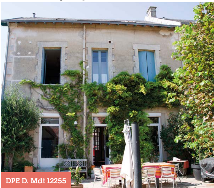
DPE D. Mdt 12255

Honoraires à la charge du vendeur Charges de copropriété : 3 912€/an