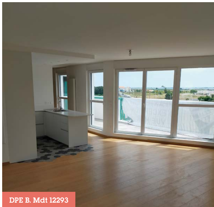
DPE B. Mdt 12293

Honoraires à la charge du vendeur Charges de copropriété : 1 465€/an