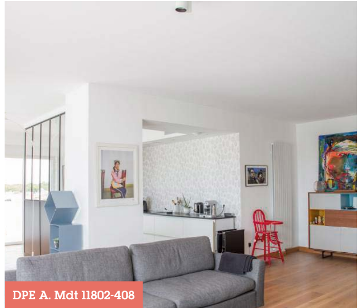
DPE A. Mdt 11802-408

1 622 545€ hors honoraires Honoraires charge acquéreur : 4% TTC (64 902€)