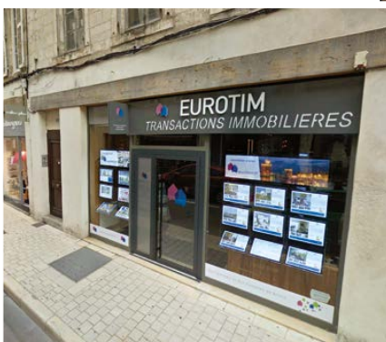
Retrouvez les bureaux d' EUROTIM au 64 rue des Merciers 17000 La Rochelle