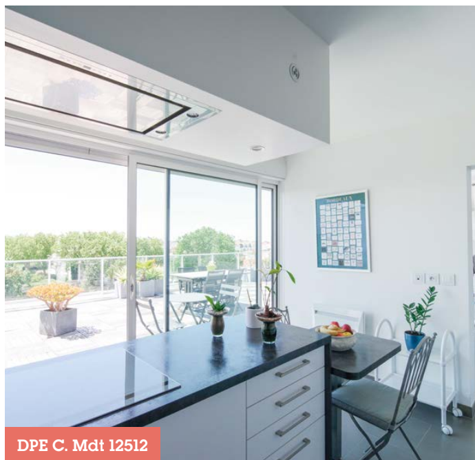
DPE C. Mdt 12512

650 000€ hors honoraires Honoraires charge acquéreur : 4% TTC (26 000€) Charges de copropriété : 4 364€/an