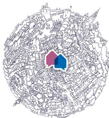
EUROTIM La Rochelle

« Bienvenue dans les pages d'IMMTIM, le magazine de l'actualité du groupe MEDIATIM PROMOTION – EUROTIM.