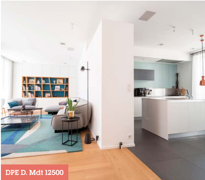
DPE D. Mdt 12500

La Rochelle / Maison / 250 m 2 / 7 pièces 1 687 447€ HAI