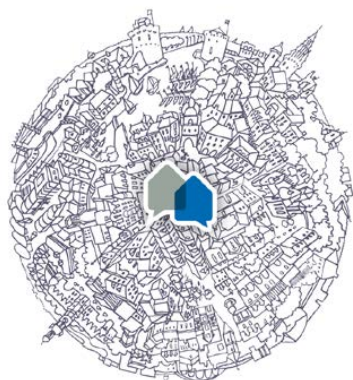
MEDIATIM PROMOTION La Rochelle