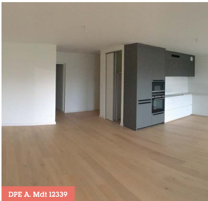
DPE A. Mdt 12339

La Rochelle-Minimes / Appartement / 101,47 m 2 / 3 pièces 518 000€